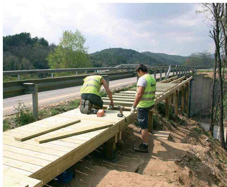
Dos obrers munten l'entramat de la passera del cementiri

Fa uns mesos es va construir una vorera per facilitar l'accés a peu al polígon, l'entrada del qual també es va reordenar amb la construcció de dues illetes que han donat més fluïdesa al trànsit. Aquestes illetes van permetre passar d'un únic carril a un d'entrada i dos de sortida, un dels quals serveix d'incorporació a la carretera comarcal en sentit Sant Hilari Sacalm. □