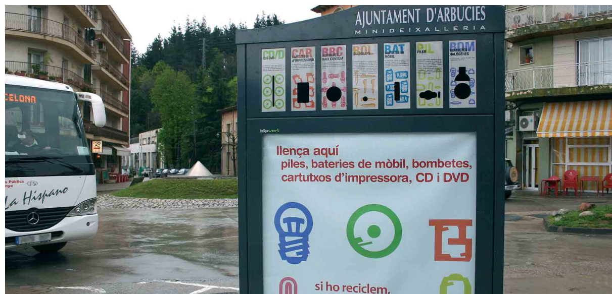
Un primer pla de la nova minideixalleria que s'ha instal·lat recentment a la Placeta de Can Reus

A partir d'ara ja no s'haurà d'anar fins la deixalleria per abocar segons quines fraccions ja que el nou contenidor es troba en un lloc de pas com és la Placeta de Can Reus. La minideixalleria, patentada per Blipvert, s'ha instal·lat amb èxit en d'altres municipis catalans, però Arbúcies és el primer