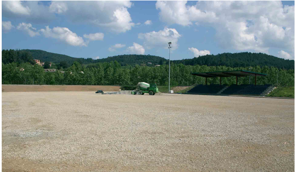
Una panoràmica recent del Camp de Futbol, en obres

Ja falta poc perquè el camp de futbol tingui gespa artificial. Les obres van començar fa uns mesos i han consistit en l'aixecament del ferm per soterrar tubs, instal·lar el sistema de reg i posar d'altres serveis que revertiran en una millora