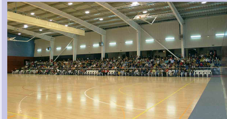
A dalt, el Pavelló de Can Pons ple de gom a gom per veure l'espectacle de l'Escola de Dansa. A la dreta, el partit entre el CB Arbúcies i el Porqueres, dues imatges de ballet i l'exhibició de judo.