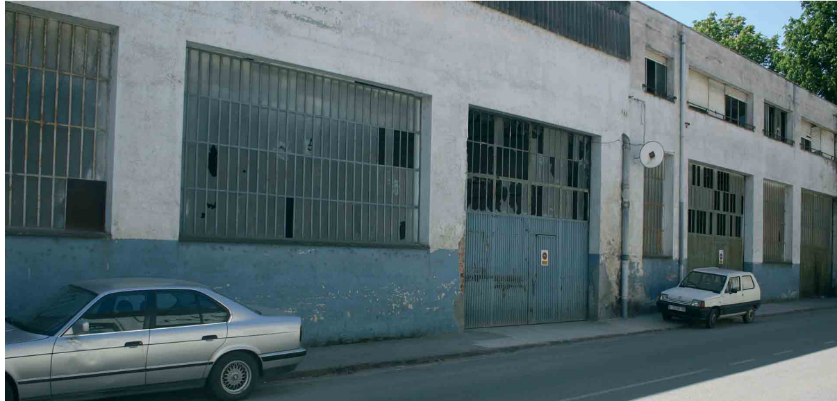
Les antigues naus de Ca l'Ayats en una imatge recent