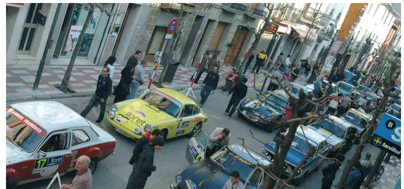
El carrer Francesc Camprodon es va omplir d'antics cotxes de ral·lis

L'organització del tretzè tram va anar a càrrec de l'Ajuntament d'Arbúcies i del