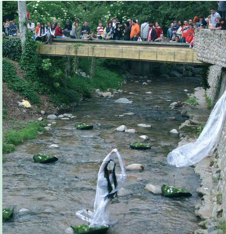
A dalt, l'espectacle de titelles al Gorg Nou. A sota, una parada de la mostra d'oficis tradicionals. A la dreta, l'espectacle Dona d'Aigua , que va reunir molt públic al voltant de la riera

Arbúcies va viure una edició de la Fira de l'Aigua marcada per l'homenatge a Santiago Rusiñol en el 75è aniversari de la seva mort, i per la recuperació del Passeig de la Riera com un dels punts principals d'atenció pels molts visitants que es van arribar fins la vila.