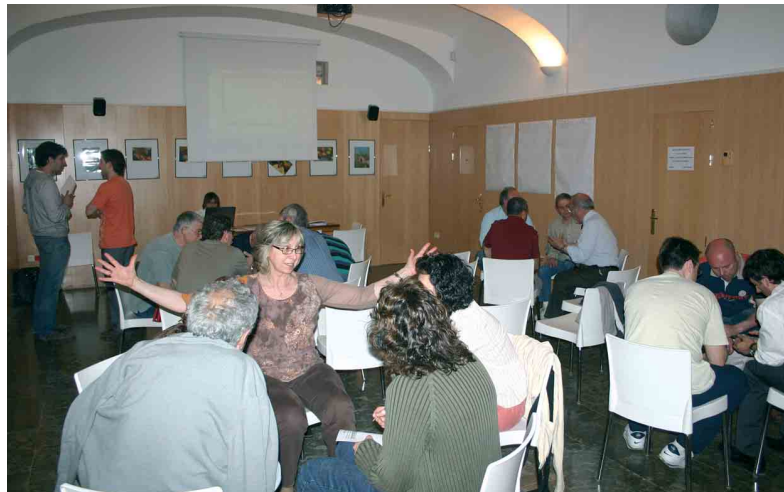
Els assistents es van repartir en grups de treball durant la sessió participativa

La sessió, dinamitzada per la consultoria Neopolis, tenia un contingut clar: treballar i prio-