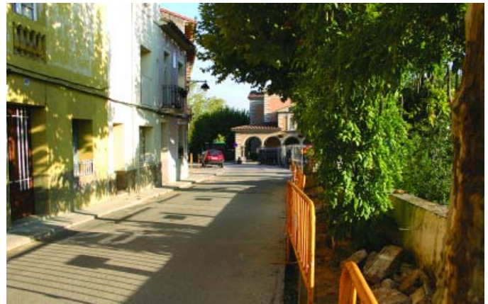
Al carrer de la Pietat ja han començat les obres

Per exemple, l'eixamplament de voreres, el soterrament de la línia de baixa tensió, la millora de la xarxa d'abastament de l'aigua, la instal·lació soterrada de la xarxa de gas propà i l'ordenació dels aparcaments davant del Col·legi Vedruna són algunes de les accions previstes. Les obres s'han adjudicat per 411.190 € i es calcula que duraran fins a principis de l'any que ve.