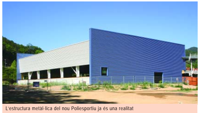
L'estructura metàl·lica del nou Poliesportiu ja és una realitat