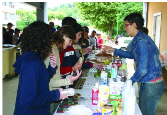
Un grup d'alumnes agafa l'esmorzar durant la jornada educativa

Sota el títol Esmorza Sa s'amaga una campanya de l'Àrea de Joventut de l'Ajuntament d'Arbúcies i del Consell Comarcal de la Selva que vol fomentar entre els estudiants de secundària la gran importància del primer àpat del dia. I què millor que fer-ho amb un bon esmorzar