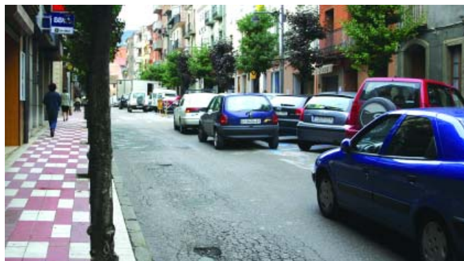
Estacionaments en doble fila al carrer Camprodon

A Arbúcies es fa servir massa el cotxe i molta gent no n'és conscient. Com que l'educació va massa a poc a poc s'han pres mesures que poden considerar-se "radicals", però que són imprescindibles per solucionar