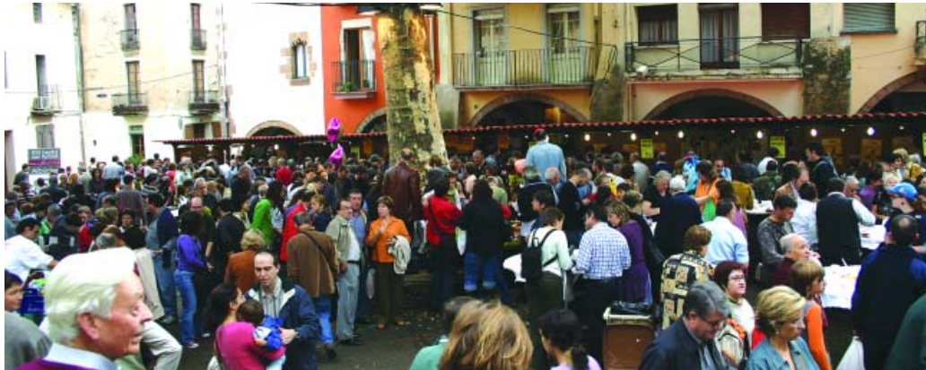
La Plaça de la Vila es va omplir de visitants durant tota la jornada

Milers de persones omplen el poble i proven el tast de bolets