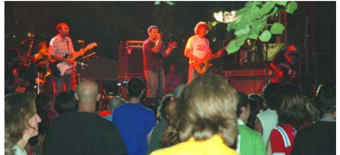
L'actuació d'Antònia Font va ser un dels concerts més esperats del PopArb

El pressupost del PopArb ha ascendit a 78.000 €, dels quals l'Ajuntament aportava 15.000 € i la resta provenia de subvencions de la Generalitat de Catalunya, la Diputació de