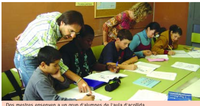
Dos mestres ensenyen a un grup d'alumnes de l'aula d'acollida

L'aula d'acollida és una iniciativa del Departament d'Educació de la Generalitat de Catalunya, i aquest any se n'han instal·lat 302 en centres educatius de primària i