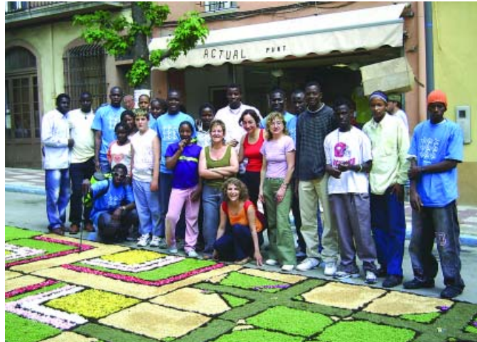
Diversos membres del col·lectiu Ndennden Ngol-len amb la catifa de les Enramades

La immigració planteja un repte importantíssim a les societats econòmicament més desenvolupades: com aconseguir la integració plena dels nouvinguts al lloc d'arribada. Evidentment no hi ha una solució màgica, però sí que es poden dur a terme un seguit d'actuacions en els diferents àmbits més importants de la