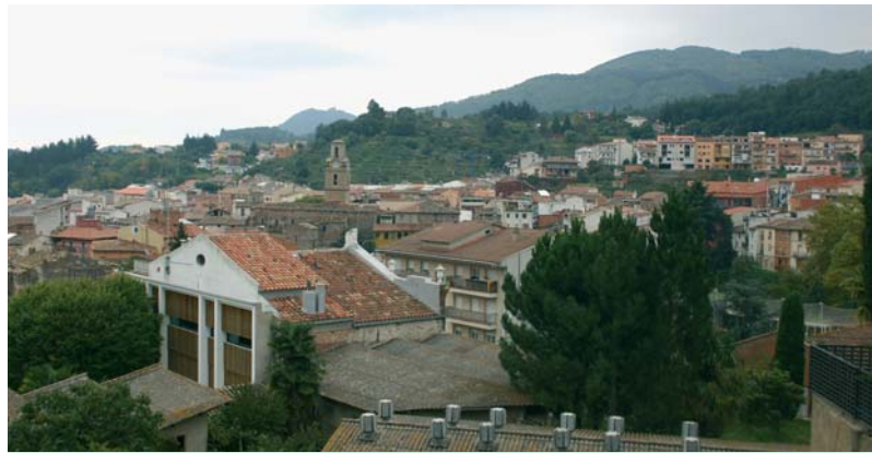
Una imatge d'Arbúcies amb el campanar al fons

La decisió del nou emplaçament s'ha de saber en un termini màxim de sis mesos, i posteriorment s'iniciarà el procés legal i administratiu corresponent per desmantellar i traslladar les antenes. El veïnat afectat formarà part d'una Comissió de Seguiment que supervisarà el projecte.