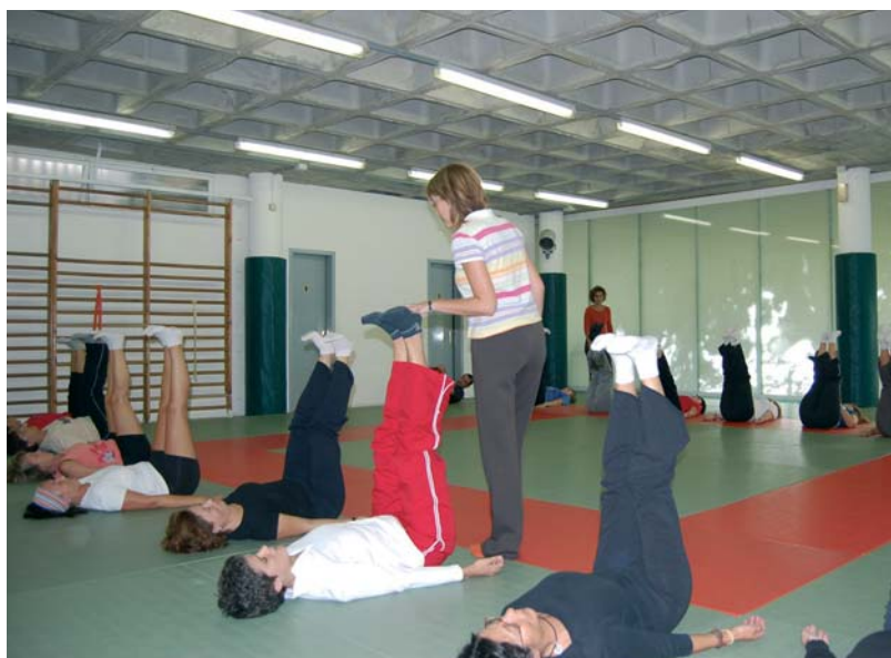
La pràctica esportiva vinculada a la salut és molt important