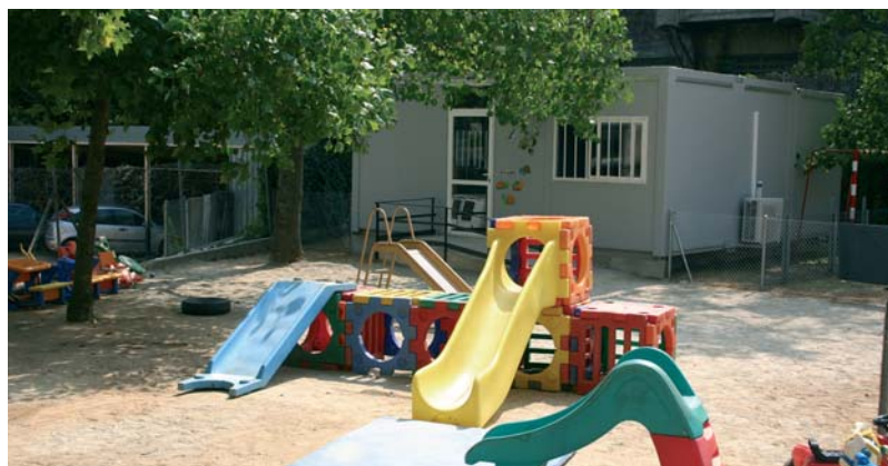
Al fons, el nou mòdul, que està situat a la part inferior del pati del centre educatiu

El mòdul, situat a la part inferior del pati, dona cabuda a una quinzena de nens i nenes i complementa els altres espais de la llar d'infants, que són insuficients per acollir la seixantena d'alumnes matriculats. La construcció del mòdul ha sigut la solució consensuada entre l'ajuntament i les famílies