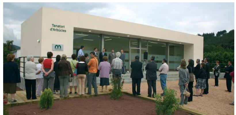
El tanatori de Cal Xic durant la jornada d'inauguració

El Polígon de Cal Xic acull des de fa uns mesos el nou Tanatori Municipal, un equipament amb dues sales de vetlla i un gran espai que es pot fer servir com a recepció i per a cerimònies civils. La seva ubicació fa que sigui una instal·lació ben comunicada i amb molt d'espai per a aparcaments. El tanatori no ha tingut cap cost per l'ajuntament, que n'ha cedit la concessió a Funerària Poch durant 35 anys. □