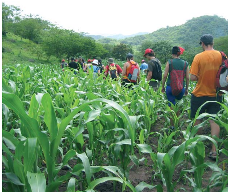
La brigada solidària en ruta pels voltants de Palacagüina

Les setze persones que integren la brigada solidària també van col·laborar en l'organització de la festa del 15è aniversari del centre d'Educació Especial "Los Pipitos" per a menors amb discapacitats físiques i psíquiques, així com