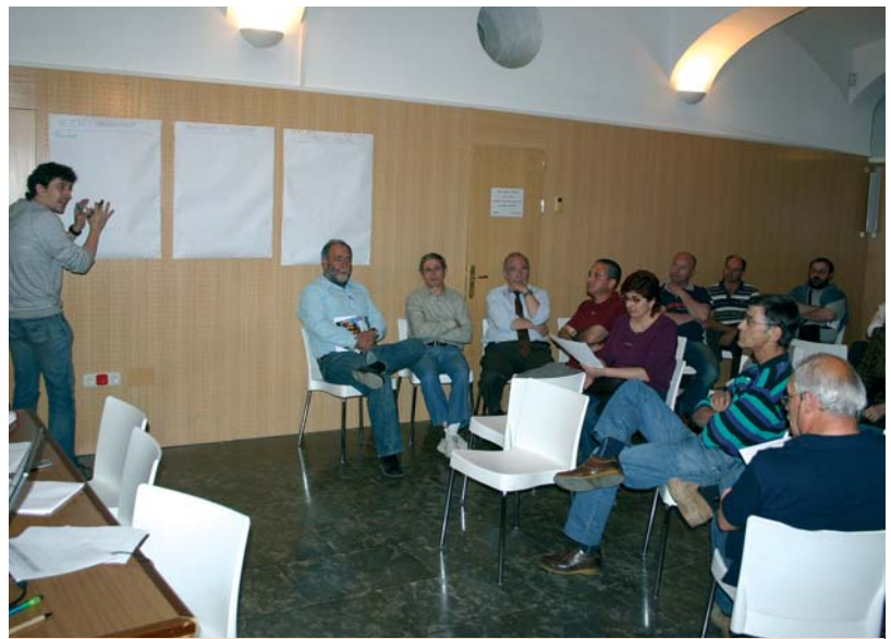
Una imatge de l'última reunió de la Taula de Barri del Camp de l'Oliver

Arbúcies, digues la teva , és l'eslògan d'una iniciativa que té el suport del Departament de Relacions Institucionals i Participació de la Generalitat de Catalunya. El projecte de les Taules de Barri es va iniciar fa dos anys i durant aquesta legislatura es preveu que es despleguin les quatre taules restants. Cal recordar que aquest procés participatiu que s'està duent a terme avui al Camp de l'Oliver és una prova pilot, els resultats de la qual serviran per acabar de definir el funcionament de les Taules de Barri. □