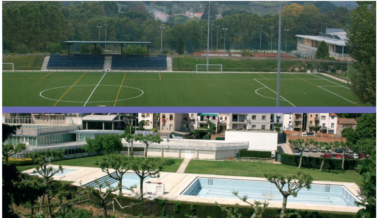
A dalt, la zona esportiva de Can Pons amb el camp de futbol, les pistes de tennis i el pavelló. A sota, les piscines i el Poliesportiu de Can Delfí

La instal·lació de la gespa artificial al camp de futbol ha enllestit definitivament l'última gran reforma pendent de la zona esportiva de Can Pons, que ara llueix completament renovada i s'ha convertit en el referent esportiu d'Arbúcies.