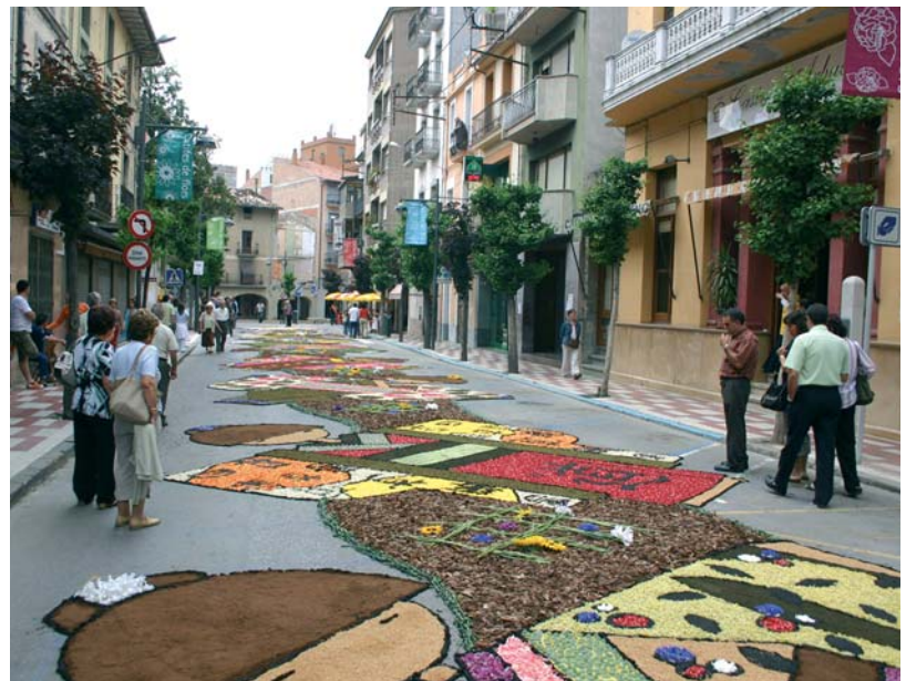
La catifa guanyadora de les Enramades s'inspirava en els quimonos orientals

La jornada catifaire va ser la més concorreguda, juntament amb la Passada del Castell i la botifarrada popular. En total es van servir 3.000 botifarres. □