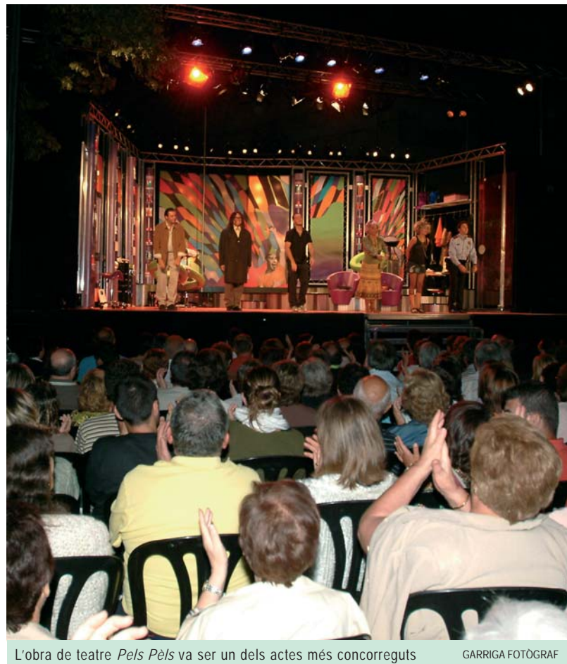
L'obra de teatre Pels Pèls va ser un dels actes més concorreguts

També hi va haver lloc per a l'esport, amb la celebració del campionat de tennis infantil, l'exhibició de judo i la cursa d'orientació nocturna, que va reunir 143 participants al llarg de dos recorreguts. Lluís Bedos (Xinoxano) i l'arbucienca Beni Montero es van imposar en el recorregut de 9 i 6 quilòmetres, respectivament. □