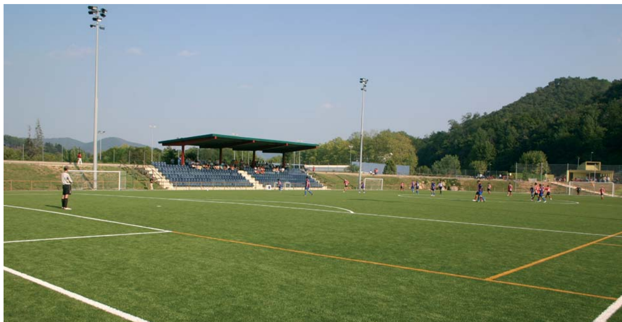
El camp de futbol amb la nova gespa artificial el dia de la inauguració

La nova gespa es va posar el passat maig per voluntat expressa de les entitats, que volien jugar el tram final dels respectius campionats sobre la nova superfície, tot i que la inauguració oficial no es va fer fins la passada Diada. Aquell dia es va disputar una jornada intensiva de partits amb els equips de base de l'Escola de Futbol Arbucienca (EFA) i l'Arbúcies CF com a protagonistes. No va ser fins la tarda que es va donar pas a l'acte protocol·lari, amb els parlaments de les autoritats, un refrigeri popular entre els nombrosos espectadors i un posterior triangular entre els equips