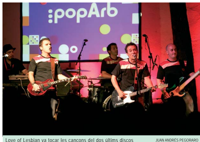
Love of Lesbian va tocar les cançons dels dos últims discos

Hores abans, La increïble història de Carles Carolina va deixar una gran impressió entre els presents a l'escenari