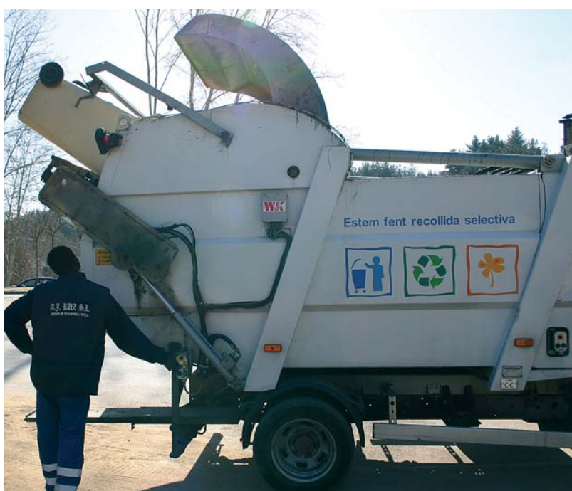
Una imatge de la recollida d'orgànica a Arbúcies

La reducció en la matèria orgànica ha sigut possible gràcies a la col·laboració ciutadana