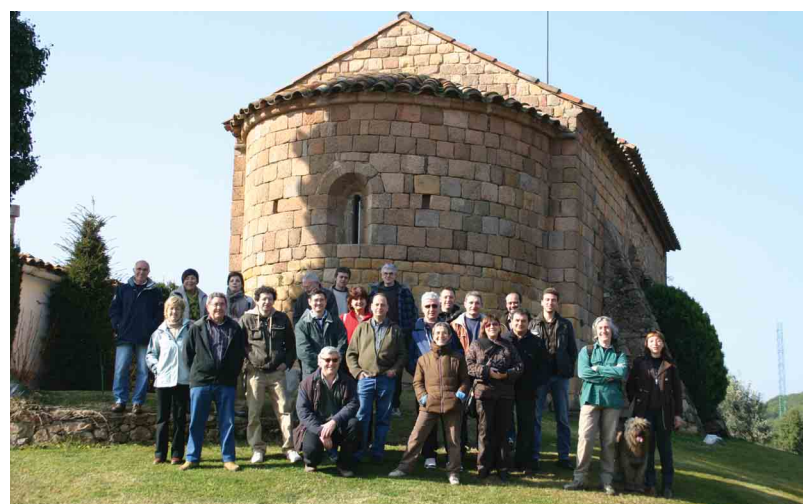
La visita a Sant Pere Desplà va culminar el curs sobre Arbúcies i el Montseny

La sessió inaugural va servir d'aproximació al medi natural, als primers pobladors i a l'ocupació del territori, mentre que l'estudi sobre el patrimoni històric i cultural va ocupar la segona i tercera jornades, amb el Castell de Montsoriu i la història contemporània d'Arbúcies (des del segle XIX fins l'ar-