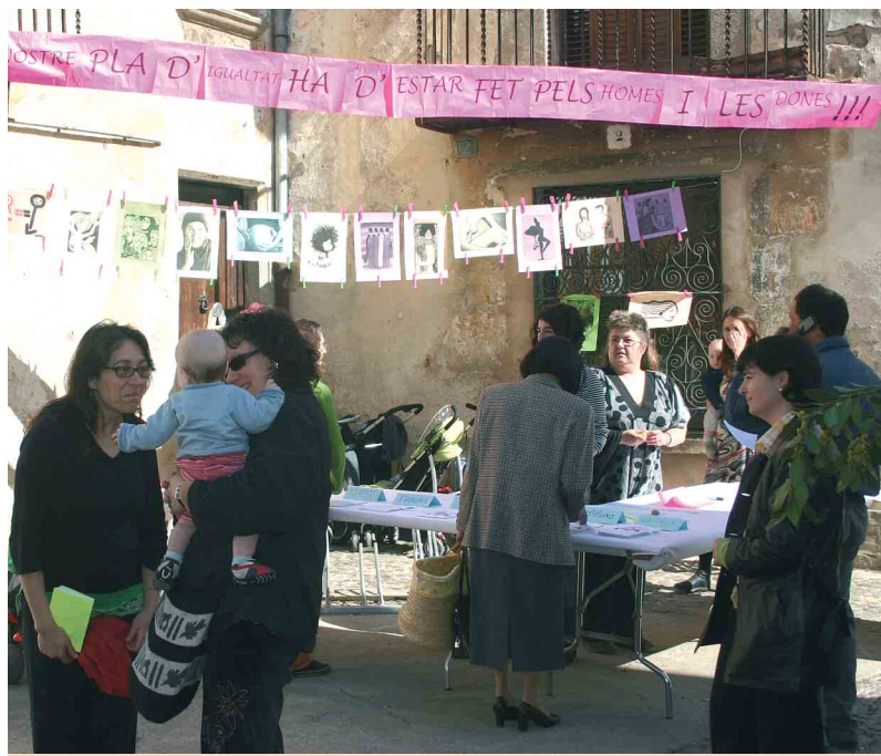
La parada que va instal·lar el col·lectiu de dones promotores del projecte

El Pla Social d'Igualtat d'Arbúcies - Les dones hi som des de sempre és un projecte participatiu que al llarg d'aquest any diagnosticarà la situació de les dones a la nostra vila amb l'objectiu que aconseguixin un desenvolupament integral com a persones. Aquesta iniciativa de