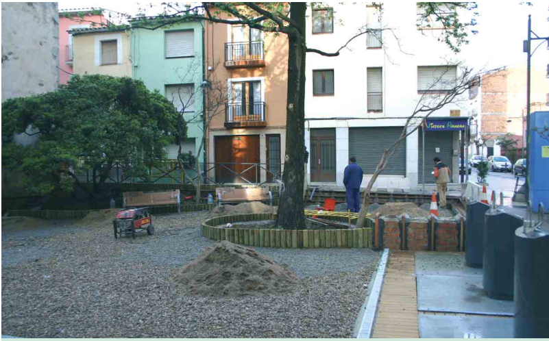
La Plaça dels Bosquerols en una imatge recent

La brigada municipal està arrançant des de fa unes setmanes la Plaça dels Bosquerols, situada entre la cantonada del carrer del Vern i Germana Assumpta, per tal de reconvertir-la en un punt de trobada acollidor i tranquil per a la gent de la vila.