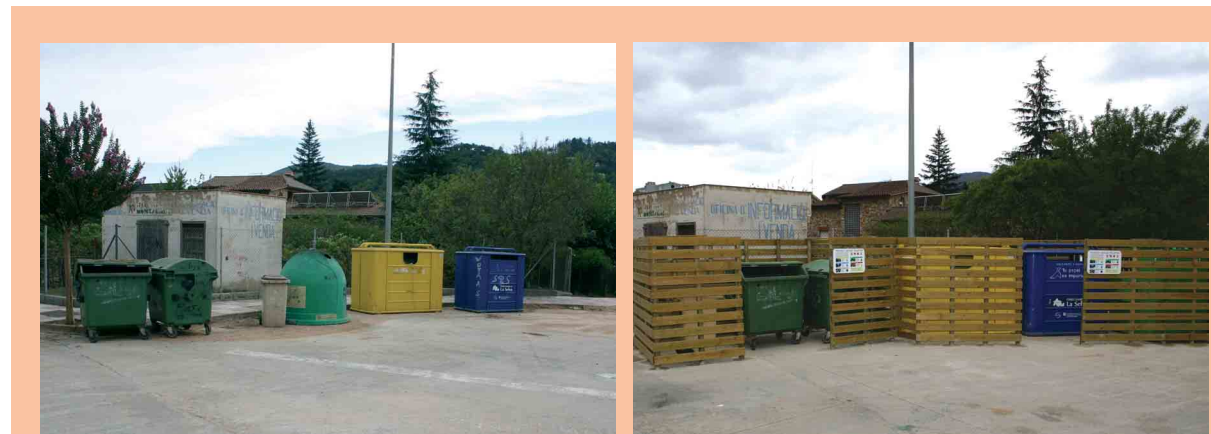
1) Tancat àrea de contenidors del carrer del Camp de l'Oliver. A l'esquerra, abans de posar al tancat. A la dreta, l'estat actual de l'espai

No totes les accions tenen categoria d'inversió. N'hi ha d'altres que reforcen un concepte