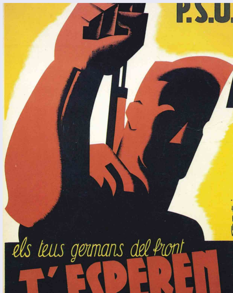
Un dels cartells de l'exposició, obra de Lorenzo Goñi

Entre 1936 i 1939 es van editar més de 2.000 cartells