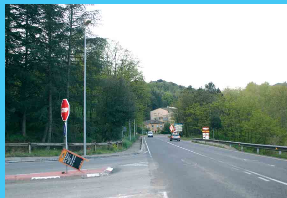
A l'esquerra, els fanals nous al camí d'accés al colomar de Pujals, i a la dreta els fanals instal·lats a les proximitats del polígon Torres Pujals

També cal destacar la instal·lació de la nova xarxa de clavegueram (foto superior dreta) al carrer Doctor Geli, l'asfaltat i els nous fanals instal·lats al camí d'accés al colomar de Pujals (foto inferior esquerra), i la instal·lació de fanals en el tram d'accés al Polígon industrial Torres Pujals (foto inferior dreta) □