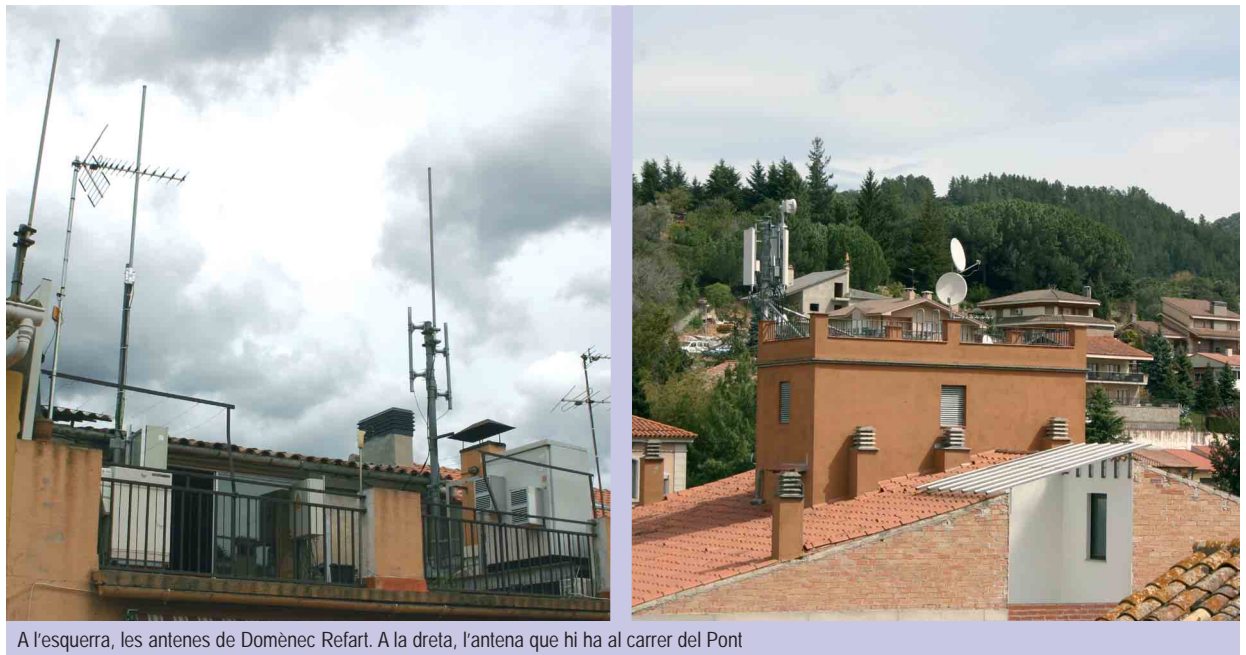
A l'esquerra, les antenes de Domènec Refart. A la dreta, l'antena que hi ha al carrer del Pont

Les antenes de telefonia mòbil que hi ha actualment a Domènec Refart i al carrer del Pont es traslladaran en un futur pròxim al sector del Sagrat Cor. Després d'aprovar per unanimitat una moció en el ple municipal del dijous 3 d'abril per traslladar les