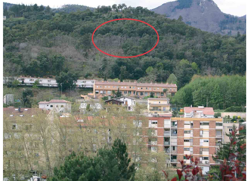
La zona del Sagrat Cor que acollirà les antenes, marcada en vermell

a tot el nucli urbà, està allunyada dels habitatges i el seu impacte visual serà reduït ja que l'antena no tindrà una gran altura i no sobresortirà de la visual de la carena. Segons un informe de Localret (consorci local per al desenvolupament de les xarxes de telecomunicacions i de les noves tecnologies) l'altra opció que donava cobertura a tot el municipi era el Turó del Pi, on hi ha els pins. Per impacte visual, millor cobertura i facilitat d'accés als serveis es creu que la millor opció és el Sagrat Cor. La realització d'estudis independents, tant en les actuals antenes com en la futura ubicació, ha determinat que el Sagrat Cor és el millor punt, ratificat en el ple municipal i amb el consens de totes les forces polítiques representades a l'ajuntament: ERC, CUPA i PSC a l'equip de govern, EPA i IA a l'oposició, així com la secció local de CiU.