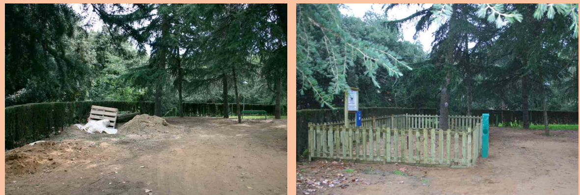
2) Instal·lació d'un pipican al costat del Sot del Palau. A l'esquerra, abans de les obres. A la dreta, el pipican adequat perfectament a l'entorn

de servei a les persones proper i eficient. En aquest sentit destaca la feina del cos de vigilants municipals, ja sigui amb els controls periòdics amb un sonòmetre per reduir el soroll