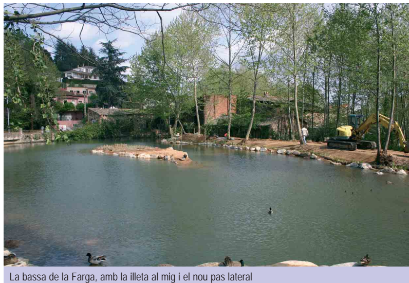
La bassa de la Farga, amb la illeta al mig i el nou pas lateral

"Li hem rentat la cara a un espai històric de la nostra vila que ho necessitava molt", assegura l'alcalde, Roger Zamorano, referint-se a la remodelació de la Bassa de la Farga, que presenta un aspecte renovat després d'un mes i mig de treballs de neteja i manteniment. Durant aquest temps s'ha buidat la bassa, retirat el llot acumulat al fons amb una excavadora, i s'ha instal·lat una base de terra i pedres al fons i al voltant de la bassa per evitar noves acumu-