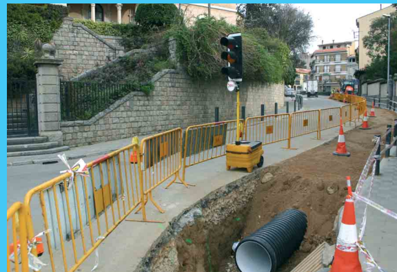
A l'esquerra, el pas i el vial per a vianants. A la dreta, les obres del clavegueram al carrer Doctor Geli, actualment ja acabades