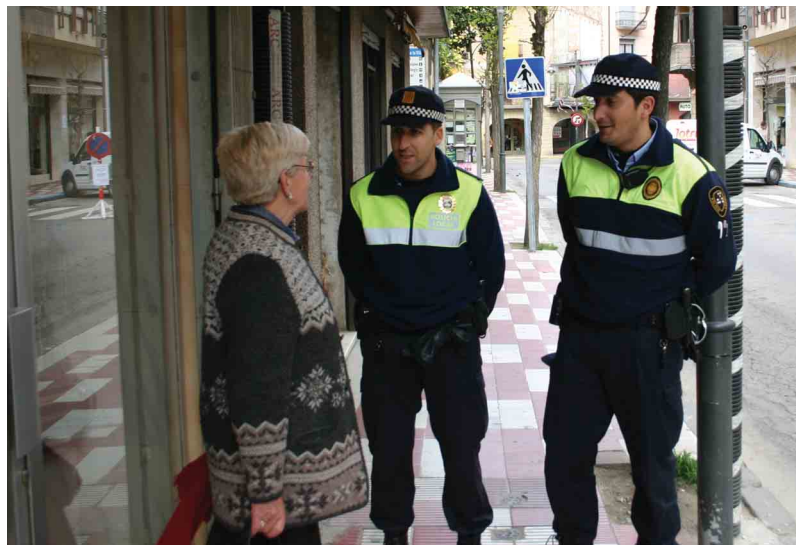
Dos agents conversen amb una veïna al carrer Francesc Camprodon

En el ple municipal del 30 de novembre del 2006 es va aprovar la sol·licitud de reconversió del cos de vigilants en policia local, però no ha sigut fins aquest març que s'ha acceptat la sol·licitud municipal. Tot i que encara no hi ha