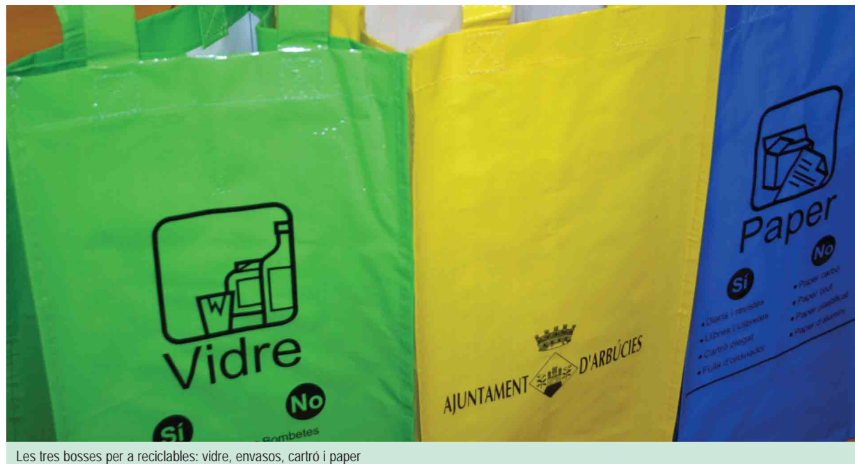
Les tres bosses per a reciclables: vidre, envasos, cartró i paper

S'ha esgotat l'estoc inicial de 1.500 paquets i ara se'n demanaran 500 més per poder complir amb un dels objectius marcats: arribar a tots els domicilis de la vila