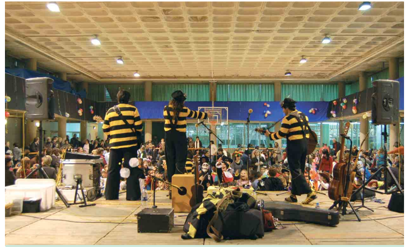
El Poliesportiu de Can Delfí es va omplir durant el Carnaval infantil

Arbúcies va celebrar intensament el Carnaval al llarg d'un cap de setmana que es va convertir en una festa per a totes les edats, sobretot en els concorreguts ball de disfresses i el carnestoltes infantil. La imaginació i la disbauxa van protagonitzar una festa capitalitzada per les comparses, que van oferir un repertori ple de contrastos en el ball de disfresses celebrat al Poliesportiu de Can Delfí. Un homenatge a la indumentària dels anys 80 present en gimnasos i classes d'aeròbic va convèncer el jurat com a millor disfressa, per la qual van guanyar un àpat de bacallà amb panses de Els Gerds.