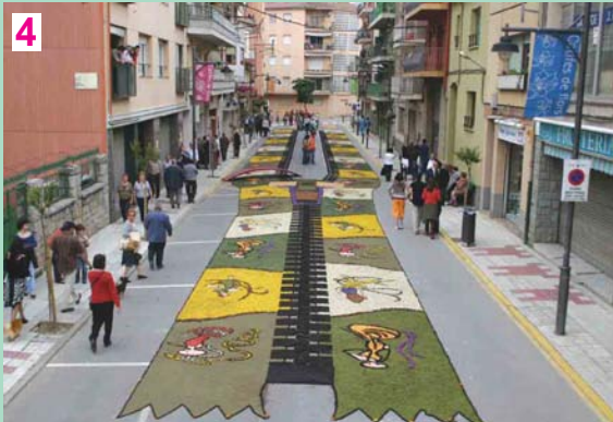
3) Més varietat de flor: Disset tipus de flor en un disseny d'arrel africana. 4) Més original: La primera catifa-cremallera de la història, amb pont inclòs

Una adaptació de les tradicionals mandales tibetanes va guanyar el premi a la millor catifa, un reconeixement que el jurat va justificar per l'acurat disseny i treball, a més d'un impacte visual molt potent. Cadascuna de les nou man-