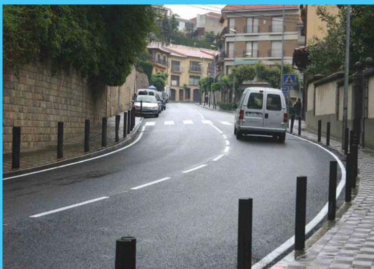
El carrer Doctor Geli amb l'asfaltat renovat