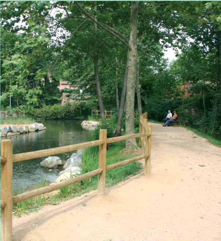
Passera de la Bassa de la Farga: Arran de la recent neteja de la Bassa de la Farga, l'ajuntament va aprofitar per obrir un nou espai per al passeig en un dels entorns més bonics de la vila. Es preveu que d'aquí uns anys s'ampliï aquesta zona amb la recuperació del pont per a l'ús públic.