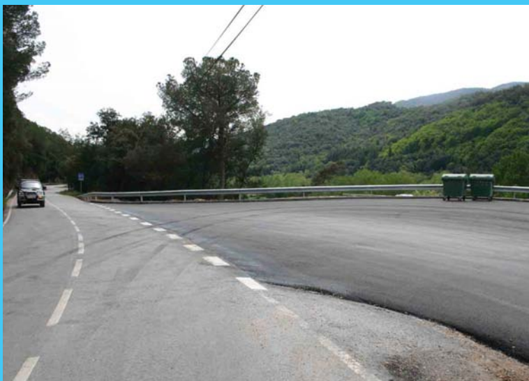
El giratori ampliat per anar a la planta envasadora ha millorat la circulació dels vehicles pesants