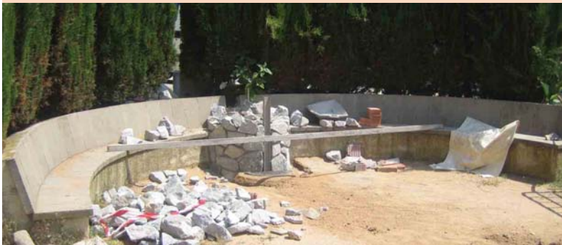
A dalt, un dels passos elevats que s'han instal·lat al carrer del Camp de l'Oliver A sota, la font que s'està construint a la Plaça Florac

L'ajuntament fa un balanç molt positiu després d'un any de funcionament de la Taula de Barri del Camp de l'Oliver, tant