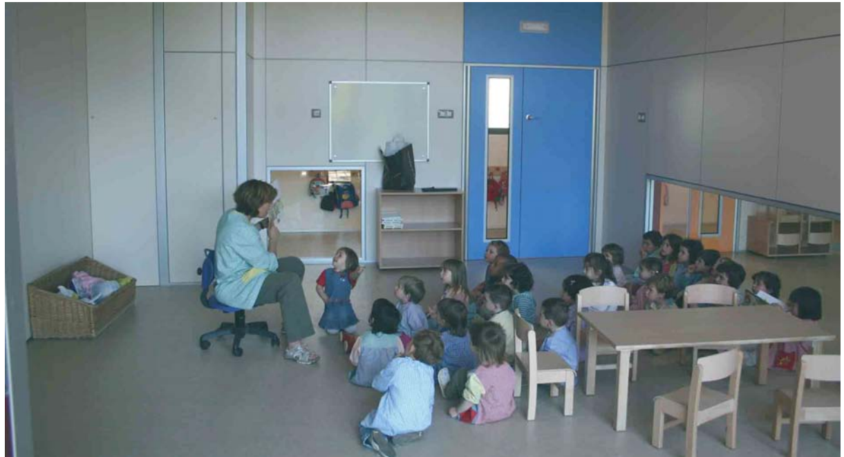
Una mestra del Jardinet explica un conte als nens i nenes durant el primer dia de classe al nou centre

Arbúcies ja té nova llar d'infants. L'estrena d'aquest equipament tan necessari es va fer el passat dilluns 16 de juny amb els nens i nenes i les mestres com a únics protagonistes, i d'aquesta manera