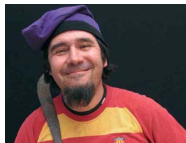
El cantautor Jordi Pujol

Entre el 29 i el 31 d'agost, el Prat Rodó acollirà la primera edició del FANC (Festival d'Arts No Convencionals d'Arbúcies), un recull de manifestacions artístiques gratuïtes