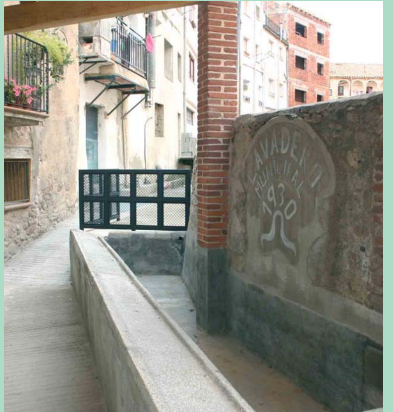
Safareig de Can Jombo: El podem trobar a la placeta del mateix nom, en un espai arraconat. És l'únic safareig cobert d'Arbúcies i el seu valor actual reflecteix el testimoni d'un temps, a principis del segle passat, en què la construcció dels safarejos va apropar la higiene i la salubritat a la gent. El veïnat del Castell n'ha fet ús fins fa pocs anys.