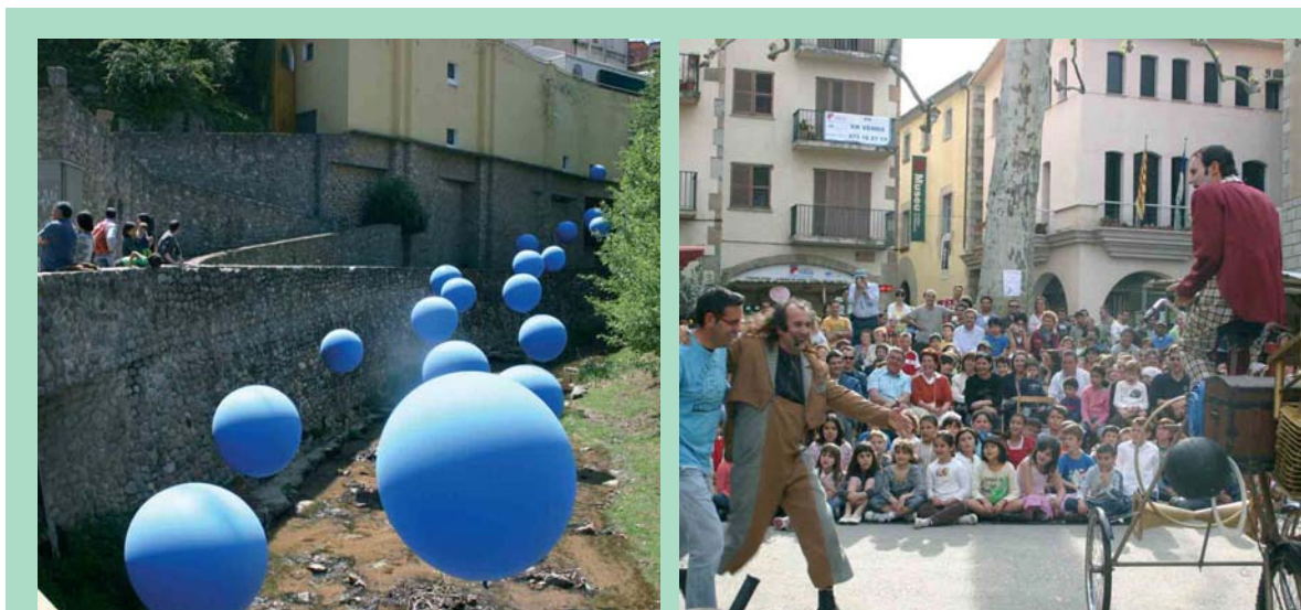
A l'esquerra, una instal·lació de globus a la riera. A la dreta, l'actuació de l'Havanera de Tim Burton . A baix, la inauguració de l'itinerari Rusiñol

A la tarda, l'espectacle acrobàtic de l'Havanera de Tim Burton