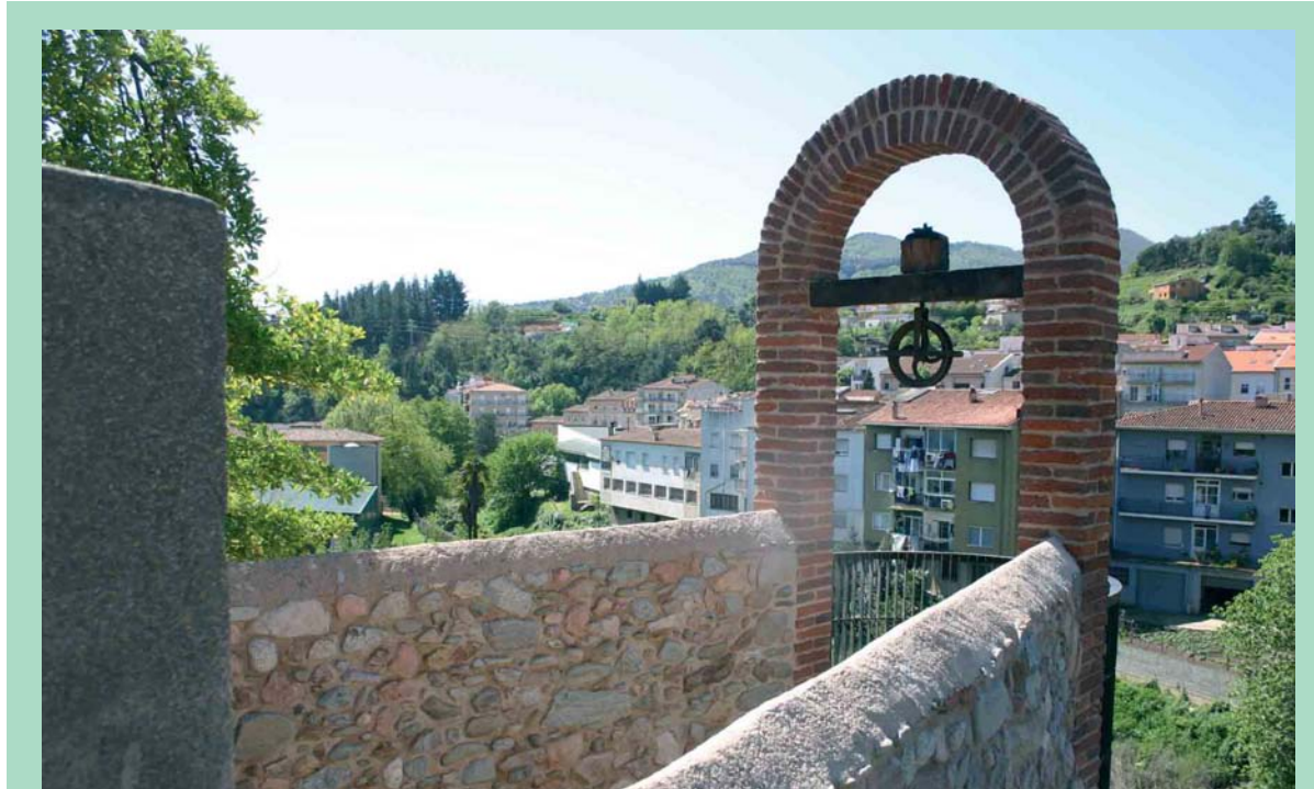
Pou de l'Escultor: Està situat al carrer de la Pietat i es tracta d'una construcció popular i funcional utilitzada per extreure aigua per a regatge i usos domèstics sense haver de baixar a la riera. Es calcula que fou excavat en el darrer quart del segle XIX, i que la construcció actual data del 1901.

Tres anys més tard això ja és una realitat amb la finalització de les obres a tres punts emblemàtics d'Arbúcies com són el Pou de l'Escultor, el safareig a la placeta de Can Jombo, i el nou passeig de la Bassa de la Farga. "Amb aquestes actuacions volem recuperar uns elements d'identitat del poble que estaven degradats i que ens han de servir per dinamitzar turística-ment Arbúcies", assegura l'alcalde, Roger Zamorano. □