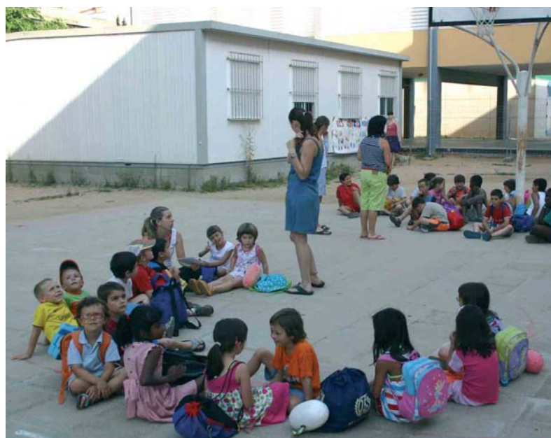
Els nens i les nenes que van a l'Esplai es reuneixen cada matí a l'IES Montsoriu

L'Esplai es fa durant el juliol i després de l'aturada del mes d'agost engegarà de nou durant els deu primers dies de setembre. □