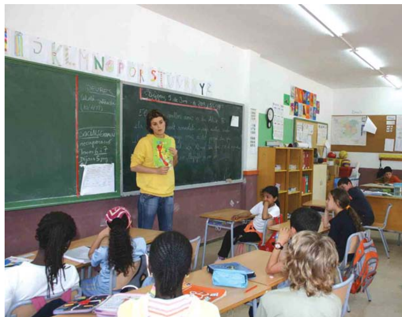
L'alumnat d'una aula del CEIP Dr. Carulla escolta les explicacions de la tècnica de Medi Ambient