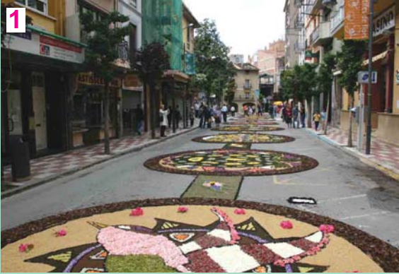
1) Millor catifa: Les mandales circulars del Tibet. 2) Millor disseny: La catifa de l'IES Montsoriu va triomfar en el 40è aniversari del centre

Un disseny inspirat en les mandales tibetanes guanya el premi a la millor composició