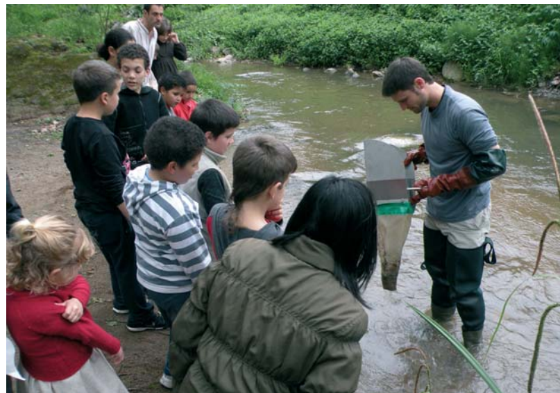
El taller de descoberta de la flora i la fauna d'Arbúcies es va fer en un tram del nucli urbà de la riera