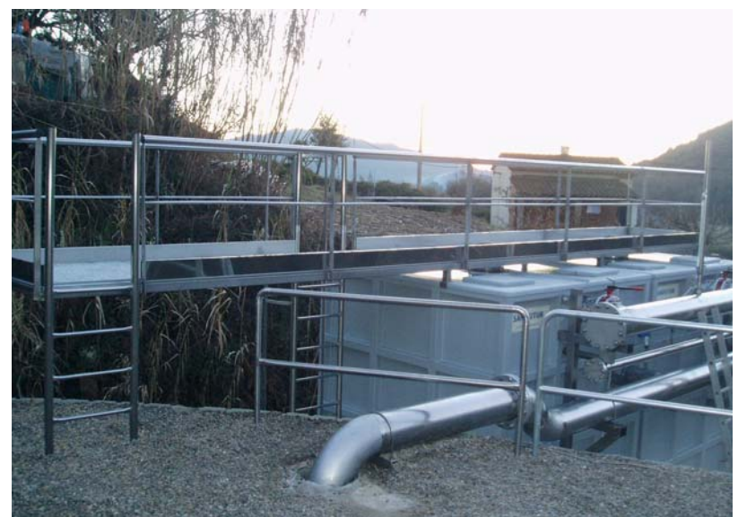
Una imatge de les noves instal·lacions, situades on hi ha els dipòsits municipals

Per tant, la població d'Arbúcies tindrà una gran qualitat d'aigua fins i tot en les condicions més adverses, i com que hi haurà un major aprofitament de l'aigua, els aqüífers de la zona d'Abeuradors estaran més plens. □