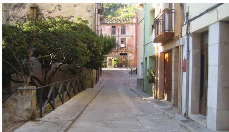
Rehabilitació del paviment d'un tram del carrer Vern (entre el carrer Sant Jaume i el carrer Castell) Pressupost: 59.031,01 euros - Empresa adjudicatària: Josep Vidal Bosch, SL Substitució del ferm actual i de les voreres per instal·lar un paviment de llosa d'un sol nivell que donarà a aquest tram el mateix estil d'illa de vianants que la resta del carrer del Vern.