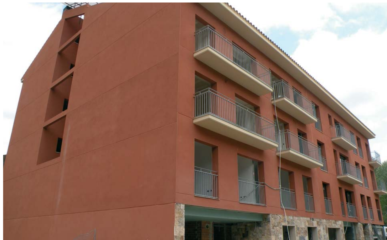
Els habitatges de protecció oficial que hi ha al carrer de la Farga

Els nou pisos de protecció oficial estan situats al carrer de la Farga, entre la riera d'Arbúcies i la Bassa de la Farga i ocupen uns 800 metres quadrats de sòl edificable. Les dimensions útils dels habitatges van dels 53 metres quadrats en el cas del pis més petit fins als 83 metres quadrats d'un dels dos dúplexs dels que consta la promoció. La vessant social del