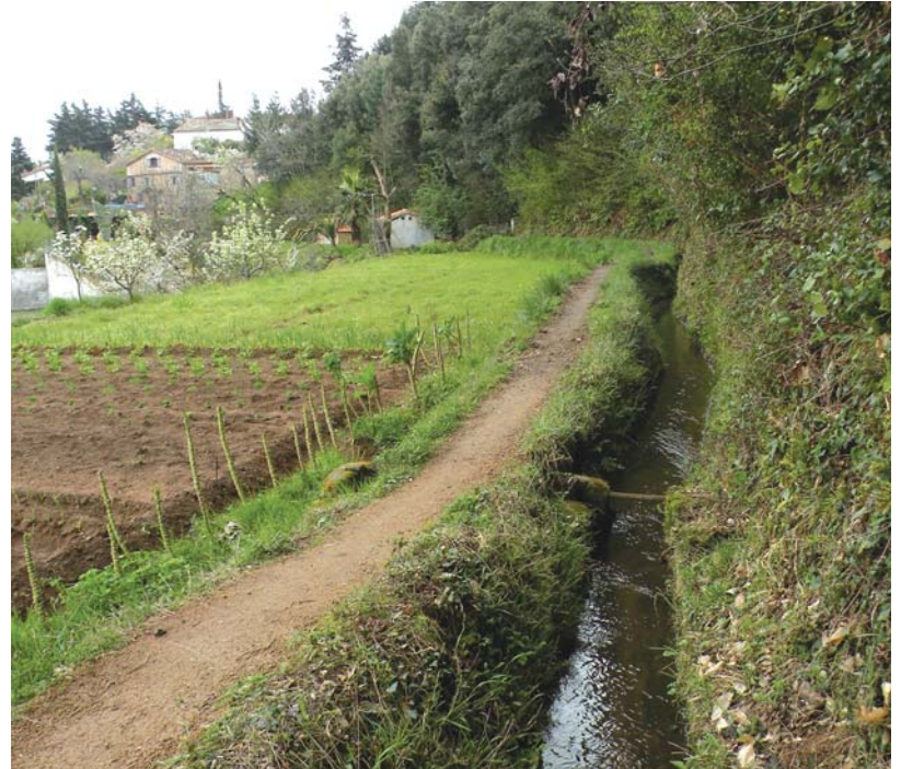
Un rec situat en uns terrenys propers al barri del Castell

El projecte abasta sis comunitats formades per 200 regants i un total de 20 quilòmetres de rec, un recorregut en què la pèrdua d'eficiència en la captació i en el transport de l'aigua és molt important, amb punts concrets que arriben al 80%. □