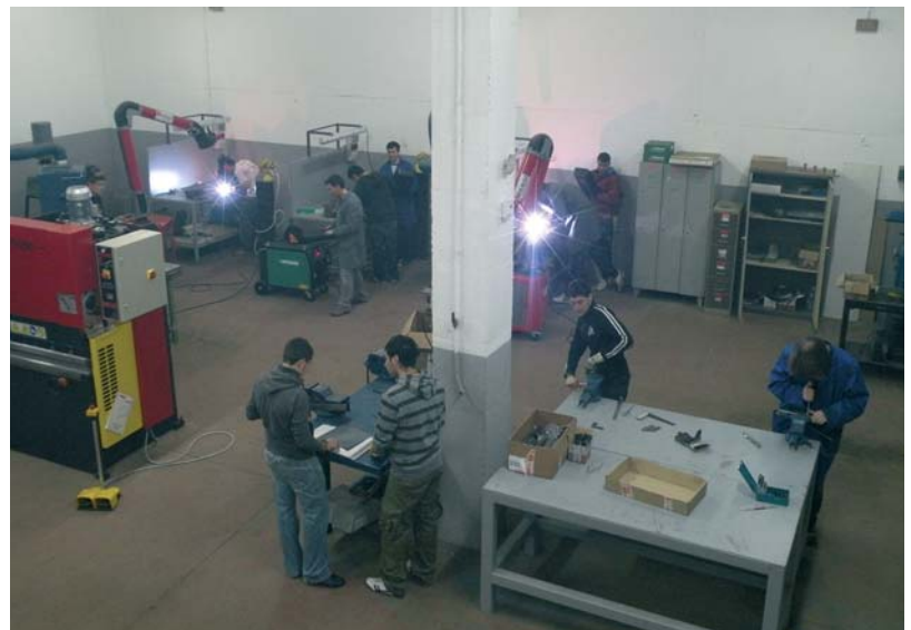
El taller està situat en una de les naus que hi ha a sota la benzinera de la variant

Formar professionals preparats per a la indústria carrossera