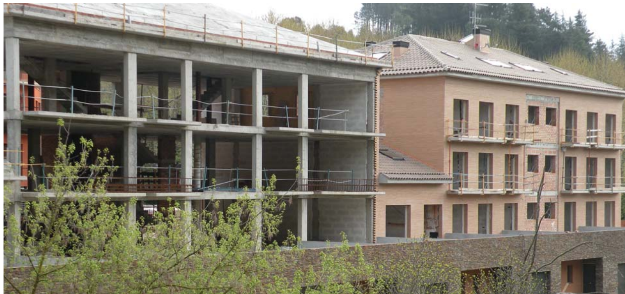
Uns habitatges de nova construcció que hi ha al carrer de la Farga

La voluntat de l'ajuntament és recollir les aportacions de la gent d'Arbúcies respecte l'habitatge i és per això que