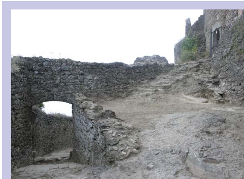
Una imatge de la barbacana, amb el portal a l'esquerra

-Restauració del tram de muralla nord i est de l'accés principal al castell, amb la torre d'accés i el cos de guàrdia.