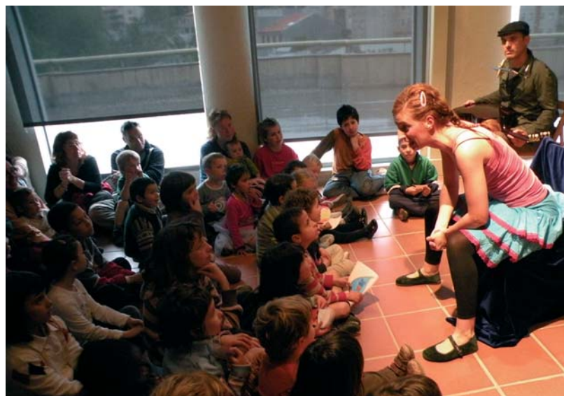
L'espectacle infantil El Monstre de Xampú es va traslladar al Museu Etnològic del Montseny

Amb la Fira de l'Aigua, l'Ajuntament d'Arbúcies vol fomentar el coneixement del patrimoni natural i humà de la vila i del Montseny i conscienciar de la importància que té l'aigua a la nostra vida diària, sempre amb un sentit lúdic i apte per a tots els públics. És per això que les activitats es dirigeixen a determinats col·lectius que poden interioritzar comportaments i hàbits de consum responsables amb el medi ambient, com la mainada. És aquí on s'emmarquen el taller de descoberta de la flora i la fauna de la riera d'Arbúcies, i un espectacle com El Monstre de Xampú , en què els més petits van veure el paper determinant de l'aigua per guanyar el terrible monstre. □