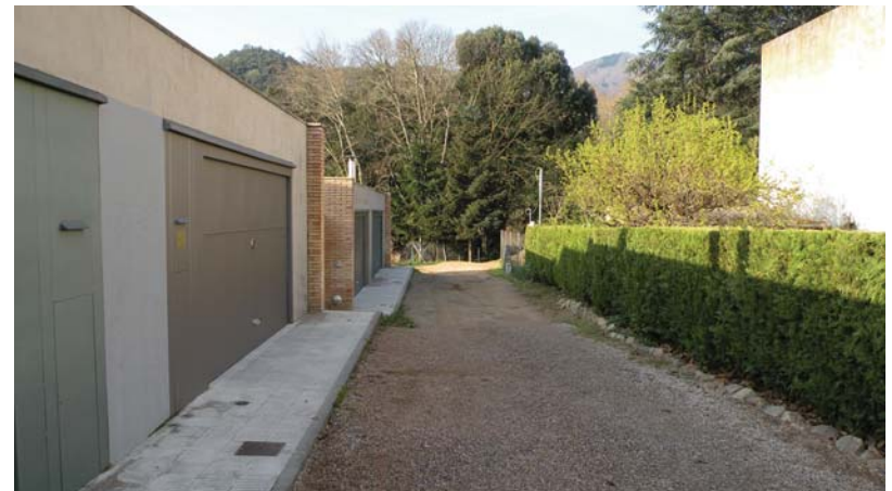
Pavimentació d'un tram del carrer Solell i del Passeig de la Glorieta (a la foto) Pressupost: 61.720,34 euros - Empresa adjudicatària: Josep Vidal Bosch, SL Substitució del paviment de terra per un de formigó que evitarà els problemes derivats de la pols i els efectes de la pluja en el ferm.