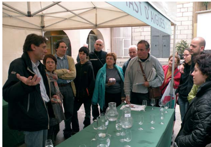
El tast d'aigües celebrat a la Plaça de la Vila

Durant la tarda del dissabte, el museu també va acollir la presentació de la Guia Il·lustrada de Flora i Fauna del Parc Natural del Montseny . L'endemà, els visitants van poder buscar flors i plantes remeieres, seguir un itinerari guiat per la riera i visitar el fons botànic del Jardí Dendrològic del Roquer. □