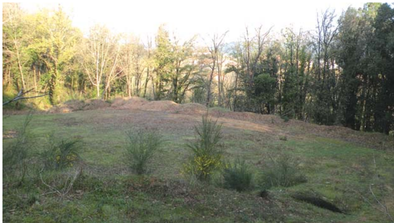
Construcció d'un edifici com a local social per a les colles de caça arbucienques, situat a les serres de Can Quadres Pressupost: 155.458,84 euros - Empresa adjudicatària: José Do Nacimiento El nou local social de les colles de caçadors serà un punt de trobada i un espai social que permetrà fer el repartiment de la cacera en unes condicions higièniques adients.