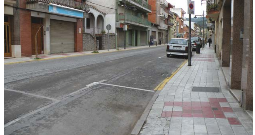
Rehabilitació de les voreres del carrer Segimon Folgueroles i del Turó del Campament Pressupost: 169.531,56 euros - Empresa adjudicatària: Manzano Arbúcies, SL Substitució i canvi de les voreres i la vorada a Segimon Folgueroles, una actuació que segueix la línia de millora de les voreres iniciada amb els carrers Magnes i Pietat, així com Germana Assumpta. Pel que fa al Turó del Campament s'arranjarà la vorera dreta en el tram que va de Loreto Mataró fins l'encreuament amb el Sagrat Cor per tal de donar continuïtat de pas als vianants.

L'ajuntament divideix els diners del fons en diversos projectes que executaran sis empreses de la vila