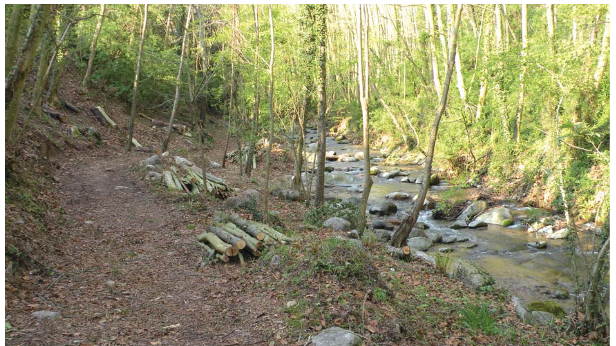
A l'esquerra de la riera, una part del camí que s'ha desbrossat en els darrers mesos

El conveni assenyalava com a prioritari la millora de la vegetació autòctona i la substitució de les espècies al·lòctones (forànies) que estiguin en mal estat per altres pròpies del