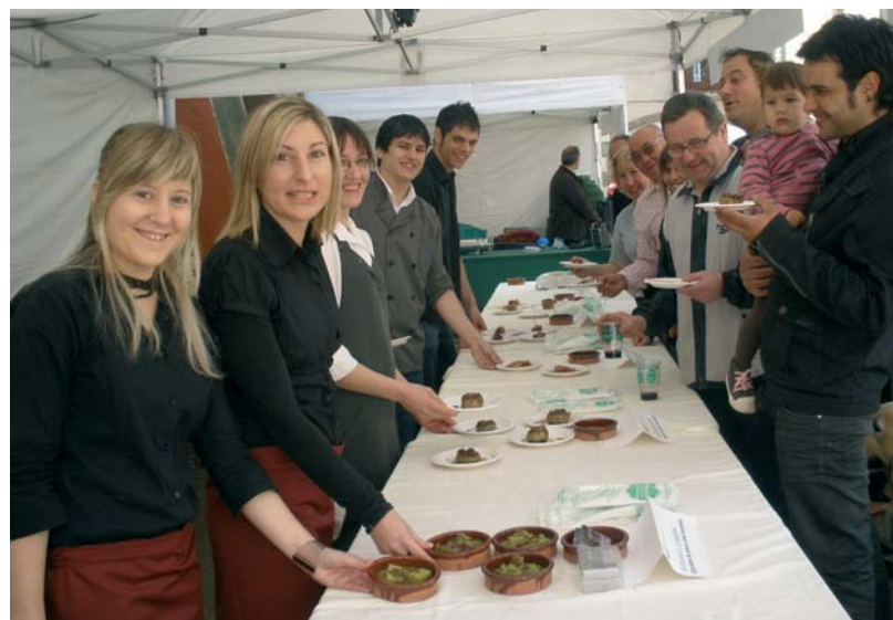
Cinc restaurants d'Arbúcies van oferir un tast gastronòmic basat en productes de l'horta i el cargol