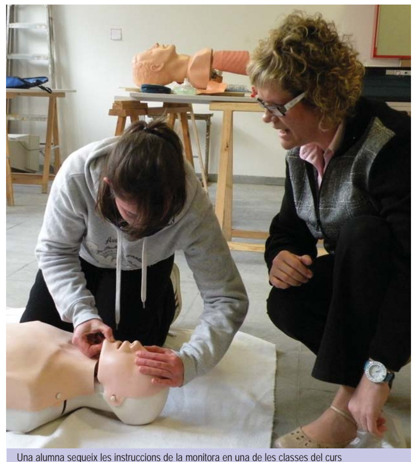
Una alumna segueix les instruccions de la monitora en una de les classes del curs

L'adquisició dels desfibril·ladors i la realització del curs respon a les demandes de les entitats esportives del municipi, i ha sigut possible gràcies a l'aportació econòmica de l'Ajuntament d'Arbúcies i d'una subvenció provinent de l'organisme Dipsalut de la Diputació de Girona. □