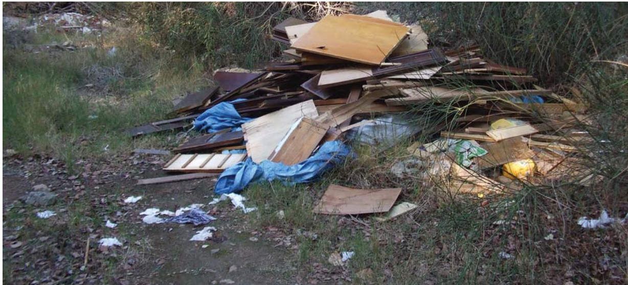
Un dels abocaments de runa localitzats per l'ajuntament

Es tracta de diversos abocaments il·legals, els quals estan tipificats per ordenança com una infracció molt greu i amb sancions que van dels 3.001 als 6.000 € de multa