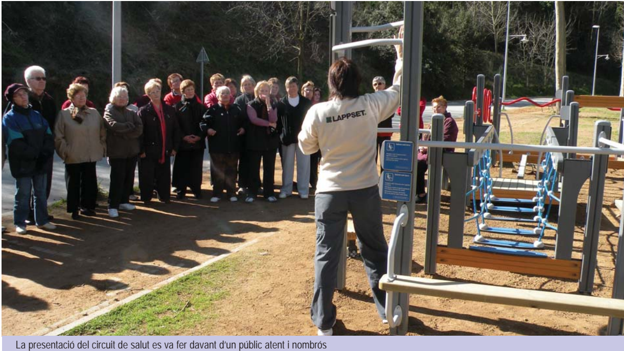
La presentació del circuit de salut es va fer davant d'un públic atent i nombros

Arbúcies ja té un nou circuit de salut per treballar la mobilitat bàsica de les persones grans. La instal·lació serveix per reforçar l'autonomia del