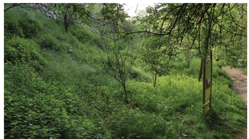
Condicionament del Passeig de la Riera d'Arbúcies Pressupost: 59.003,99 euros - Empresa adjudicatària: Excavacions Rosell, SL Millora de l'espai del pomari d'Arbúcies amb la construcció d'una escullera i el condicionament del tram del passeig adjacent a la feixa. També es farà l'obra civil per a la instal·lació de l'enllumenat en el tram del passeig de la riera que va de Can Delfí al Gorg Nou.