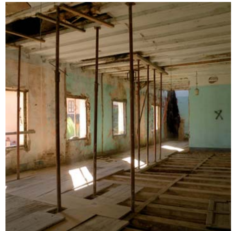
L'edifici de Can Delfí, en obres. A dalt, una vista aèria. A l'esquerra, l'espai entre Can Quiquet i l'edifici. A la dreta, una estança.