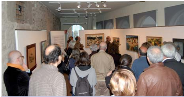
La visita guiada durant la inauguració de l'exposició

Els paisatges de la Selva vistos per alguns dels millors pintors catalans de finals del segle XIX i del segle passat. Paisatges naturals i d'altres creats per l'home en diversos estils pictòrics recollits a l'impressionant L'Atlas Paisatgístic de les terres de Girona .