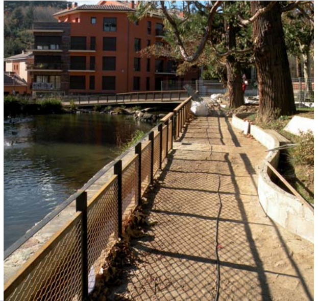
A l'esquerra, una de les passeres de fusta. A la dreta, el tram de terra que uneix la bassa amb el jardí dels arboços i la tanca que s'hi ha instal·lat