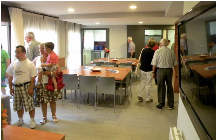
El menjador de la nova llar - residència durant la jornada de portes obertes que es va fer el dia de la inauguració

Arbúcies ja disposa d'una nova llar-residència per a dotze persones amb discapacitat intel·lectual. Està situada al carrer de la Farga en un bloc de nou pisos de protecció oficial promoguts per l'Ajuntament d'Arbúcies, que ha cedit a l'Associació Montseny Guillerries aquest pis