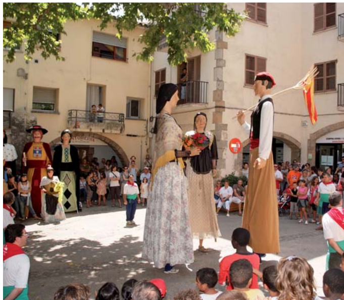
Els gegants d'Arbúcies durant la cercavila de la Festa Major

La Festa Major d'Arbúcies es celebra entre el divendres 29 de juliol i el dimarts 2 d'agost i arriba carregada d'activitats per a tots els públics. L'ajuntament i la comissió de festes han previst un programa en què destaca la darrera obra de Teatre de Guerrilla, El Xarlatan , dirigida i interpretada per Quim Masferrer, a més del ball amb l' Orquestra Selvatana i la zona de barraques nocturna. No hi faltaran les sardanes i la tornaboda, i la implicació de les entitats segueix present amb la mostra de dansa, la cercavila de gegants, el bateig de