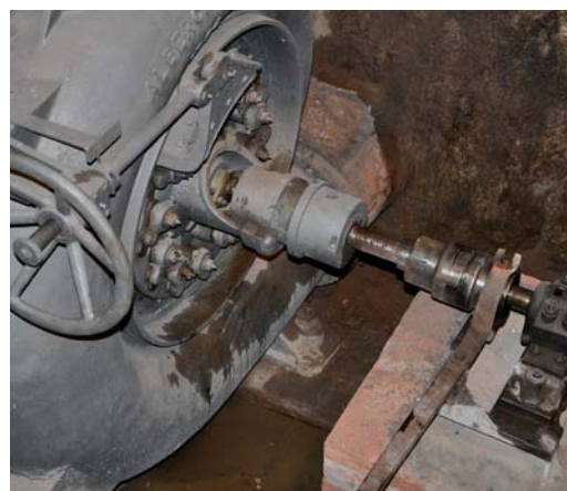
A l'esquerra, l'edifici de la Farga. A dalt a la dreta, una serradora. A sota, la turbina que es troba a la part inferior de l'edifici