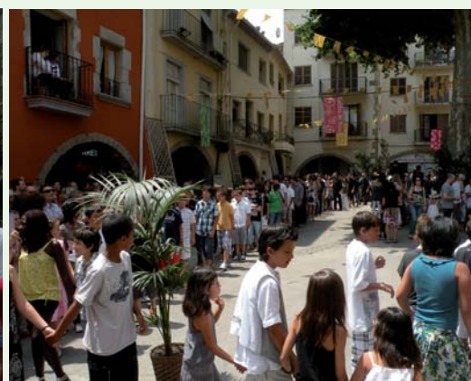
A dalt a l'esquerra, la catifa guanyadora del carrer Sorrall. A la dreta, un detall de la catifa amb el millor disseny, que també va ser considerada com la més original. Sobre aquestes línies, la ballada de sardanes posterior a la dansa de la plaça, a la dreta, amb la Plaça de la Vila plena de gent.