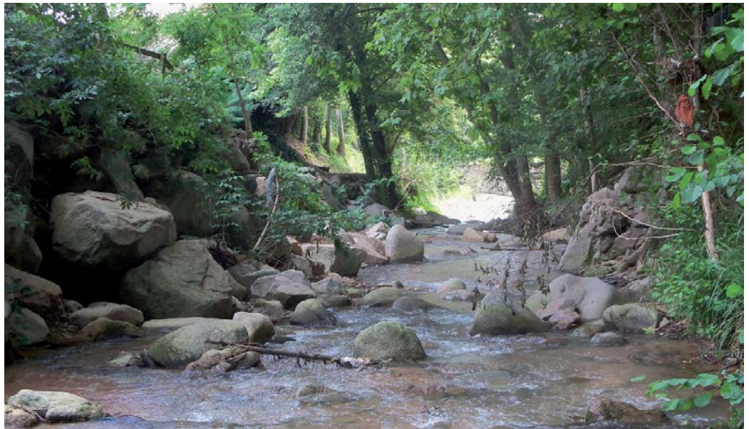
La riera d'Arbúcies en una imatge recent, just en el punt en què hi havia la passera de fusta